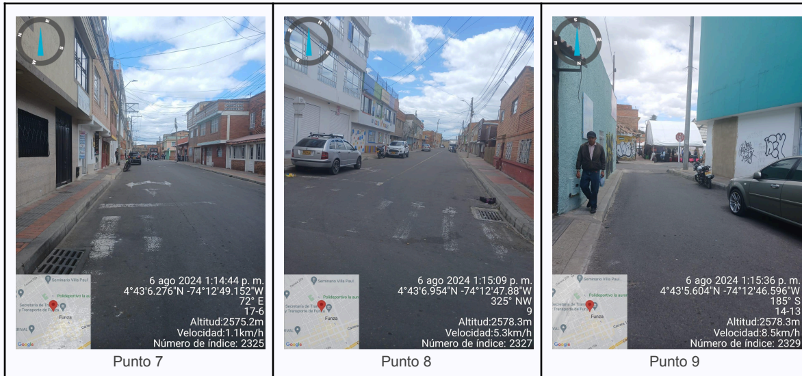
Ilustración 2. Fotos de los puntos del Recorrido de Control Y Vigilancia.